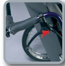
Trommelbremsen für die Begleitperson