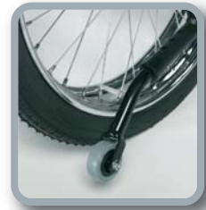
B78 - Kippschutz